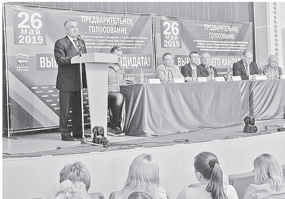
Дебаты помогают избирателям делать правильный выбор