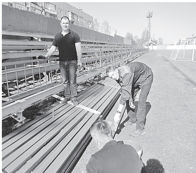
Первая секция трибуны будет готова к Дню города